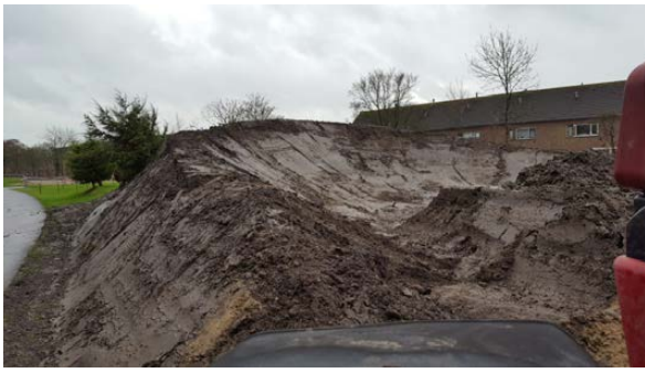
3. Kombocht B