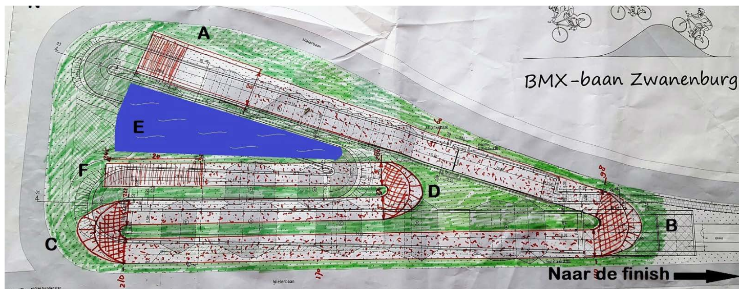
2. Toekomstige BMX-baan H.S.C. de Bataaf