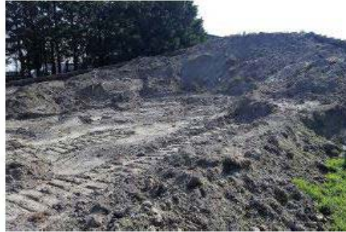
4. De achter- en voorkant van de eerste kombocht B in week 34